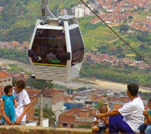
TRANSPORTE POR CABLE