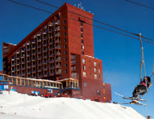
CENTROS DE ESQUÍ