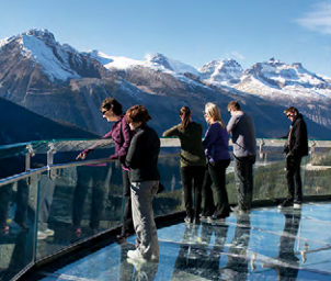
TURISMO 4 ESTACIONES